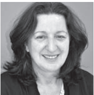
UNIV.-PROF. DR. ELKE MADER

„Um Lateinamerika als vielfältigen Raum zu verstehen, muss man das Zusammenwirken von verschiedenen Dimensionen im lokalen wie globalen Kontext analysieren. Der Universitätslehrgang Interdisziplinäre Lateinamerika-Studien bietet Studierenden aus unterschiedlichen fachlichen und beruflichen Kontexten die Möglichkeit, wissenschaftliche Kenntnisse zu einer großen Bandbreite von Themen und Forschungsfeldern zu erwerben. Das Studium umfasst sowohl Grundlagen der Lateinamerikaforschung und ihrer Methoden als auch spezialisierte Themenfelder in Hinblick auf die inhaltlichen Schwerpunkte zu politischen, ökonomischen, sozialen, kulturellen und ökologischen Fragen. Ein wesentlicher Aspekt des Studiums ist die konkrete Auseinandersetzung mit Lateinamerika im Rahmen eines Forschungsaufenthalts in der Region. So können die Studierenden Kompetenzen zu verschiedenen Facetten dieses Großraums erwerben und dabei auch die Diversität wissenschaftlicher Zugänge kennen lernen.“